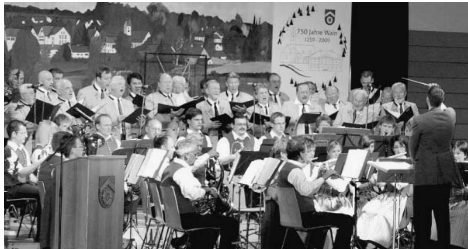
Das Blasorchester des Musikvereins und der Männergesangsverein „Sängerkunst“ bestritten den klanggewaltigen Schluss des Konzerts.

musizierten Ausflug ins schottische Hochland – „Highland Legend“ von John Moss. Ganz aktuell – man denke an die Somali-Piraten – unternahm die rund 45 Jugendlichen dann eine Reise zu den Piraten in der Karibik.