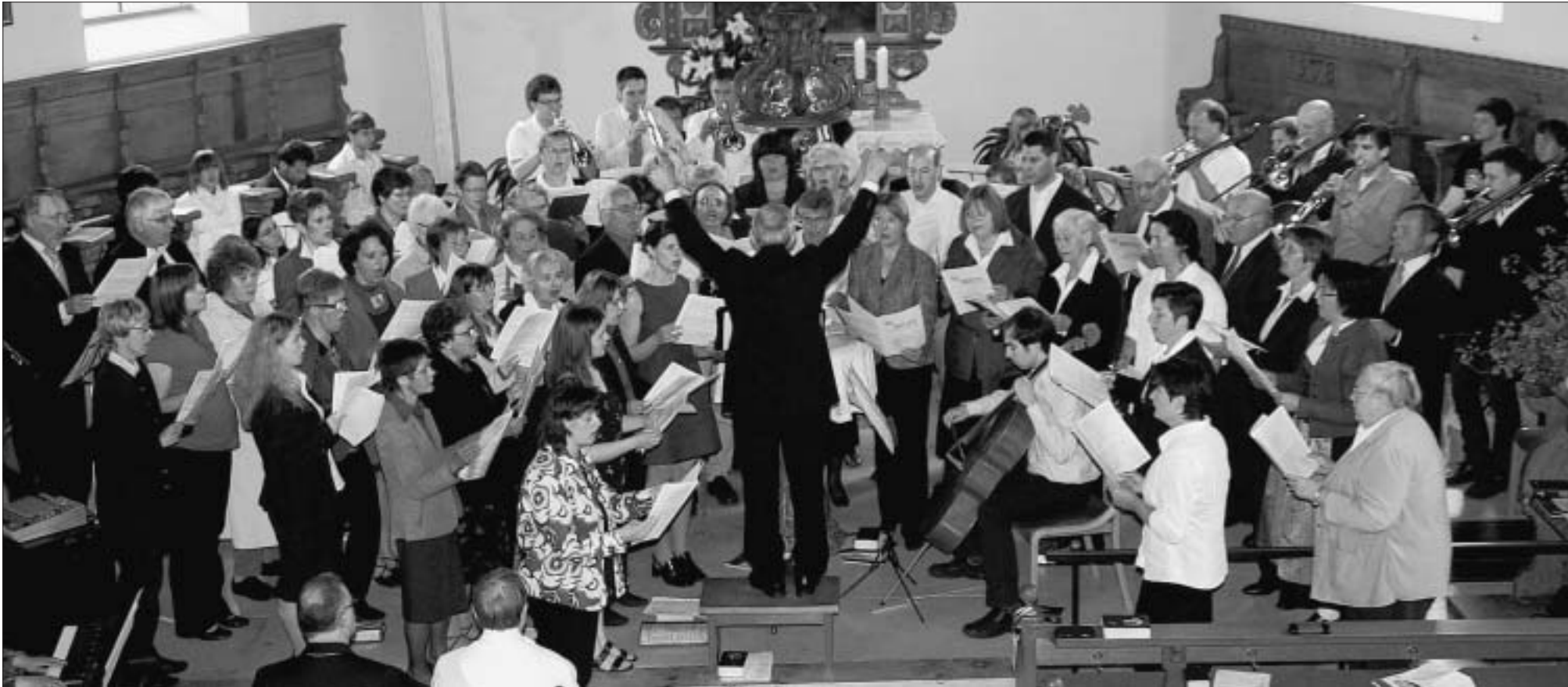
Der Wainer Kirchenchor und der Posaunenchor bereicherten den Festgottesdienst in der Michaelskirche.